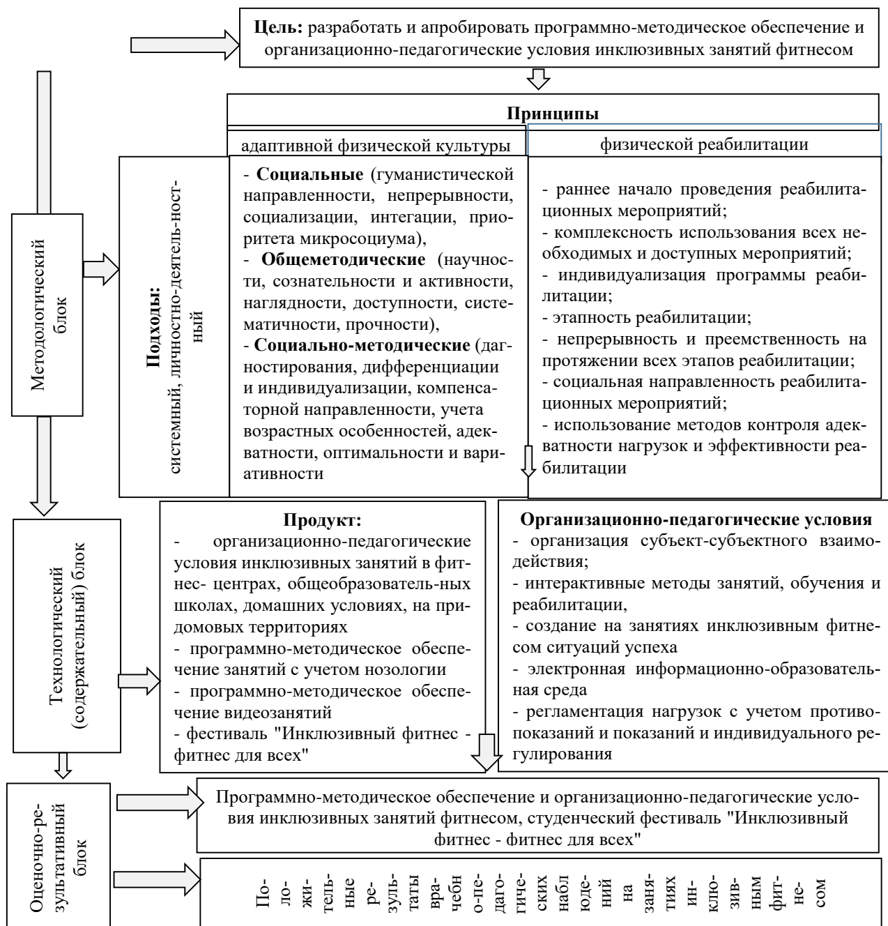
Рис. 1. Модель проекта "Инклюзивный фитнес - фитнес для всех!"